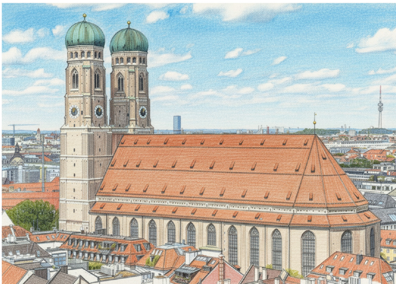
Die Frauenkirche in München