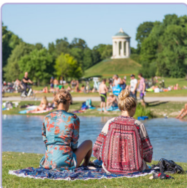
der Englische Garten