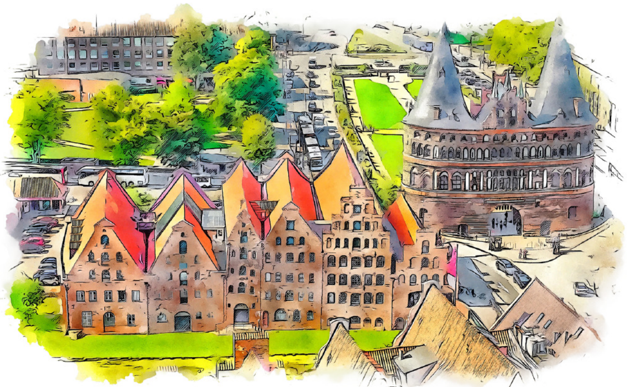
Das Holstentor und die Salzspeicher der Altstadt Lübecks