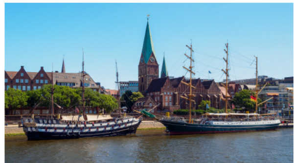
Das Segelschulschiff Alexander von Humboldt und andere hölzerne Segelschiffe auf der Weser. Im Hintergrund die St.-Martini-Kirche, Bremen.

Anfangs taten sich die Städte zusammen, um ihren Handel zu stärken. Nach 1450 wollte man eine festere Allianz gründen.